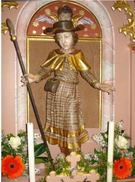
Heiliger Wendelinus, Rokoko, Mitte 18. Jht. Das alte Gnadenbild von Sulpach wird heute nur noch zum Patrozinium in der Kapelle aufgestellt.